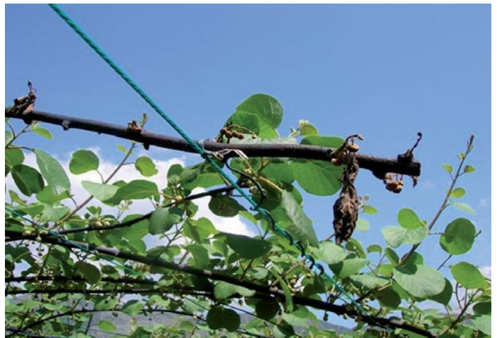
Tralcio di kiwi colpito da batteriosi.

stante e piuttosto consistente. Purtroppo, si ha la sensazione che la messa a fuoco della biologia del batterio, del suo comportamento in relazione al clima e all'ambiente agronomico del frutteto, delle modalità di infezione e diffusione sia ormai ad un buon livello di conoscenza ed approfondimento, mentre l'individuazione delle possibili strade per combatterla con una apposita cura incontra ancora diversi vari problemi. A partire dal presupposto, che di fatto oggi regola il settore delle batteriosi, della mancanza di "medicine" specifiche per combatterle che non siano quelle già conosciute per l'azione di parziale prevenzione: rame, eventuali antagonisti naturali. Non citiamo gli antibiotici perché già si sa che sono vietati in agricoltura e dove impiegati in prove sperimentali non hanno comunque fornito risultati significativi.