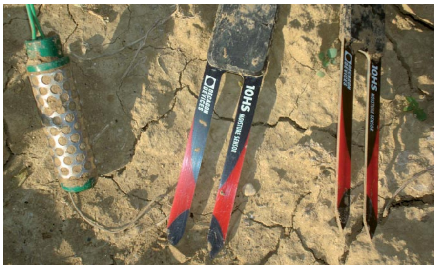
Seconda misura umidità suolo.

deve essere scelta e usata (non sfruttata) in modo oculato rispetto alla provenienza (distanza ed origine). Occorre ridurre il più possibile l'utilizzo delle acque di pozzo profondo, ma anche di quelle di falda. Le prime costituiscono infatti riserve difficilmente ricostituibili e che devono essere disponibili soprattutto per dissetare la collettività. Tra queste rientrano le acque di sorgente alpina e prealpina che con i cambiamenti climatici in corso (aumento medio della temperatura) vedono i ghiacciai diminuire la disponibilità. Le acque superficiali, spesso di varia derivazione, vanno comunque regimentate al meglio per aumentare le riserve (annuali) e la disponibilità per tutti. Questo anche per evitare i rischi di erosioni e frane nel caso si verificano piogge intense e perduranti. In tutto il mondo l'attenzione a questo argomento è forte, anche perché spesso questi fenomeni provocano veri e propri disastri.