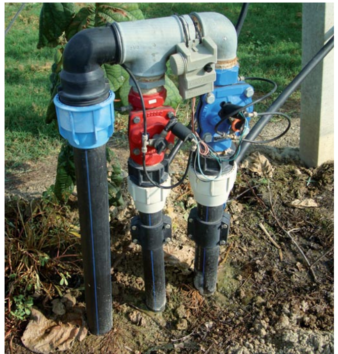
Settore irriguo con idrovalvola.