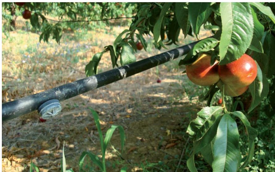
Irrigazione a goccia.

Quinto riferimento: le inefficienze delle reti idriche di distribuzione, sia quelle per adduzione irrigua che per la distribuzione urbana, sono piuttosto frequenti e non solo in Italia e determinano consumi energetici inutili in quanto legati a quantità di acqua sprecate. Moltissimi paesi sono ancora indietro su questo punto e non solo quelli poveri di risorse o in via di sviluppo. Anzi, nei paesi industrializzati,