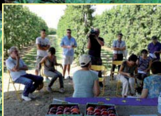
EMILIA ROMAGNA, MENO GAS SERRA DALL'AGRICOLTURA