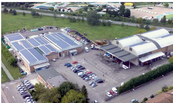
Lo stabilimento di Conselice (RA).

a 0,07 nel 2014 grazie all'aumento di capitale, l'indice del peso del capitale permanente cresciuto da 0,16 a 0,26 e l'indice di indebitamento diminuito da 15,9 a 11,7. Anche gli indici finanziari evidenziano un trend positivo e il bilancio mostra che l'incidenza degli oneri finanziari sul fatturato è pari all'1,24%, mentre l'incidenza degli ammortamenti sul fatturato è dell'1,46%. L'indicatore di liquidità primaria è passato