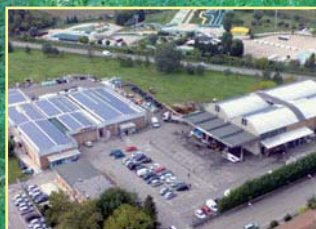
CESAC "RACCOGLIE" I FRUTTI DI SCELTE CORAGGIOSE