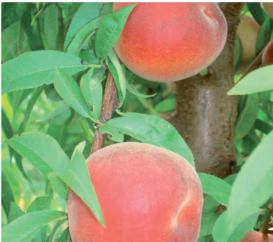
Pesche in maturazione.

A fianco dei dati, abbiamo indicato lo scostamento percentuale della previsione 2015 rispetto alla produzione consuntiva del 2014. Non proponiamo alcun commento sia per motivi di spazio, sia perché i dati sono già organizzati per paesi e regioni produttive, sia perché quando leggerete queste pagine saremo alla fine della stagione di raccolta e quindi in procinto di verificare i dati consuntivi. Durante il forum Europech svoltosi a fine aprile le previsioni erano più