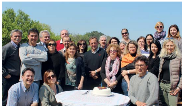
I dipendenti del Gruppo con il presidente e il vicepresidente.